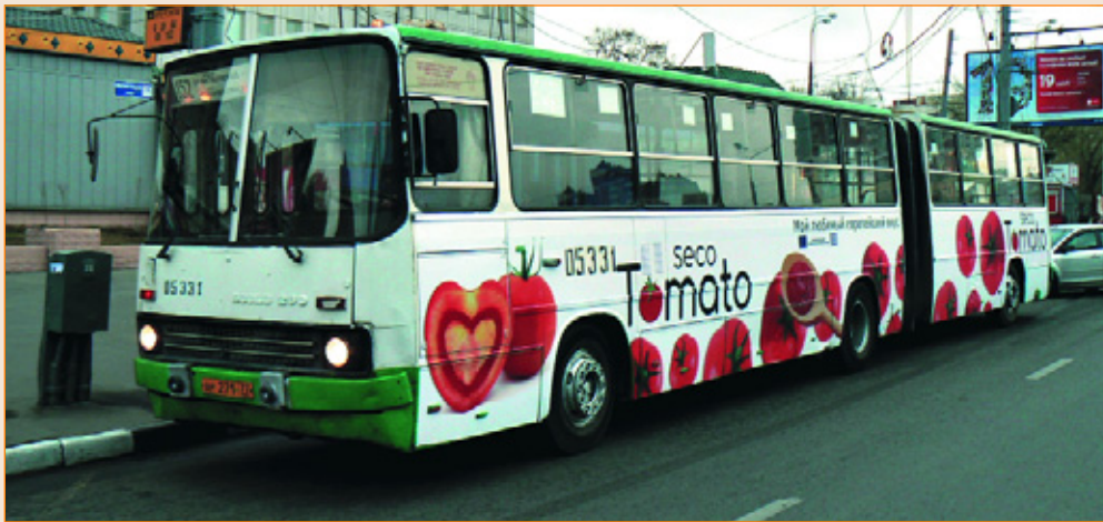
Рекламная кампания Elfruit & Tomato в Москве, 2010 г. Яркий пример варианта «меги-аборт». Размещение — РА «Нью-Тон».