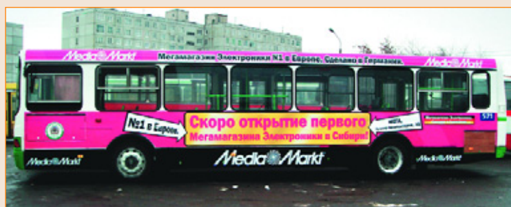
Рекламная кампания гипермаркета «Медиа Маркт», 2009 — 2010 гг. Бортовая реклама. География размещения — Тольятти, Омск, Екатеринбург, Казань. Размещение — РА «Нью-Тон».