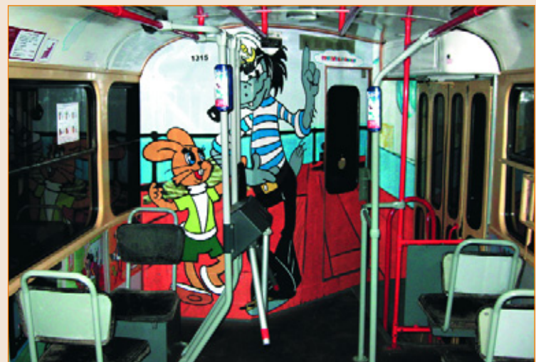
Социальный проект «Сказочный трамвайчик» в Санкт-Петербурге, 2009 г. Полное брендирование. Размещение — РА «Нью-Тон».

благодаря ширине охвата аудитории. Поэтому данный формат наряду с полным оформлением используется как для имиджевой поддержки, так и для вывода на рынок нового продукта.