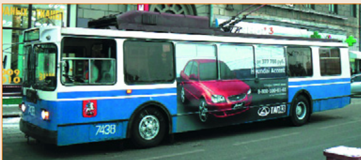
Рекламная кампания TagAZ в Москве, 2010 г. Мегиаборт 5 x 2,5 м. Размещение - РА «Нью-Тон».