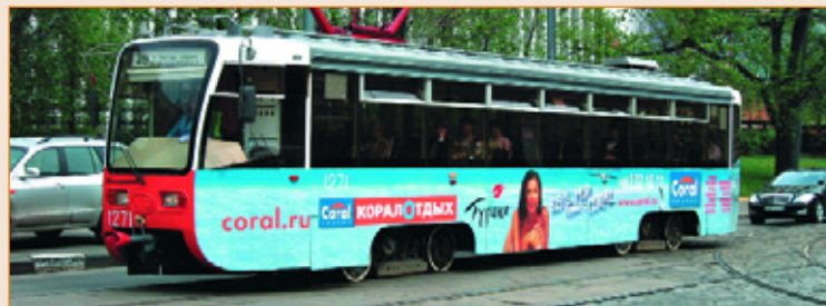
Рекламная кампания «Корал Тревел», 2010 г. Полное оформление. География размещения — Москва, Екатеринбург, Омск, Самара, Пермь, Ростов-на-Дону, Мурманск, Тюмень, Калининград, Красноярск, Краснодар, Воронеж, Кемерово, Нижний Новгород, Сургут, Челябинск. Размещение — РА «Нью-Тон».