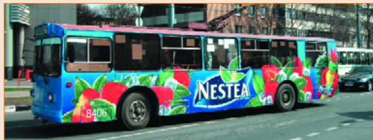
Рекламная кампания Nestea в Москве, 2010 г. Полное оформление. Размещение — РА «Нью-Тон».

Расположение рекламы с двух сторон транспортного средства делает бортовую рекламу привлекательной для рекламодателей